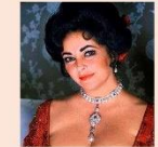
Elizabeth Taylor con La Peregina.

LITERATURA La Peregina es la parte más famosa del mundo. En el siglo XVI, el esclavo que el estrago del mar compró con villa su libertad. Después, desde Felipe II hasta nobles, espías o artistas la han poseído hasta que Richard Burton se la regaló a Elizabeth Taylor. Ahora es la protagonista de la novela Calientes Pasadas, que se titula La Agencia de La Peregina (Parabé) y que podrá alcanzar a partir de hoy.